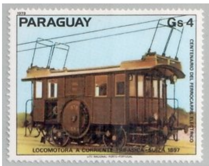
Weit gereist: Die Emmentaler Lok auf einer Briefmarke aus Paraguay. zvq

«Bei meiner Suche nach neuen Marken stiess ich kürzlich bei einer luxemburgischen Internetauktion auf einen Briefmarkensatz mit neun Marken aus dem südamerikanischen Staat Paraguay», schreibt der Sammler. Auf