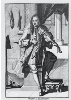
Violist oder Bratschist Kupferstich aus «Musikalisches Theatrum» von Johann Christoph Weigel, Nürnberg um 1722

Bei Bachs berühmtem DOPPELKONZERT FÜR ZWEI VIOLINEN d-Moll BWV 1043 wirkt neben der Konzertform auch die reiche Triosonaten-tradition der Barockzeit als Impuls. Allerdings lässt Bach mit diesem Werk im Grunde alle Vorbilder weit