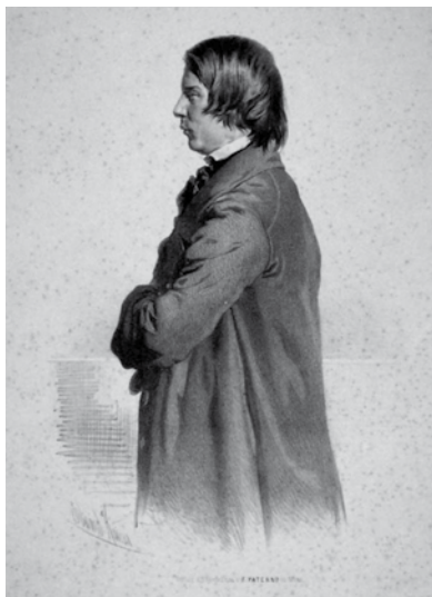
Robert Schumann Lithografie von Eduard Kaiser, um 1850 (Stadtgeschichtliches Museum Leipzig)

«Lieber Robert, wie schön, dass wir heuer Dein Geburtsjahr feiern dürfen! Wird doch allenthalben, wenn sich Eusebius und Florestan einem rundzahligen Jubiläum nähern, sogleich auf Dein unglückliches Schicksal eines für todkrank erklärten Komponisten rekurriert, wird doch gar zu willfährig der fragwürdige Versuch wiederholt, mittels Studiums Deiner Krankenakten von Endenich den gordischen Knoten aus Genie und Wahnsinn zu lösen, um hinter dem Paravent der Todesnähe irgendeinem grossen tragischen Geheimnis auf die Spur zu kommen... Hast Du uns gleich reich beschenkt, so wollen wir gerade hier in Thun Deinen Zweihundertsten als ein recht ungetrübtes schönes Fest feiern. Dazu haben unsere Künstler einen bunten Strauss gebunden und mit Perlen aus den feinsten Kammern Deiner Musik geziert. Von Deinem jugendlichen Beitrag zu den Leipziger Quartettunterhaltungen über eine