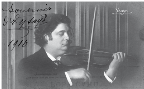
Eugène Ysaÿe, Signierte Postkarte, 1916

Wollte man all die Namen aufzählen, die seinen Weg säumten, die Komponisten, die Werke für ihn schrieben, die Musiker, mit denen er auftrat, die Élèves,